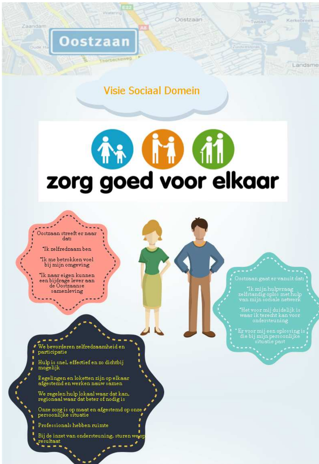
Figuur 2: Visie Wmo gemeente Oostzaan