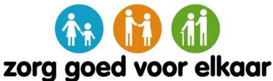
Figuur 3: Beeldmerk met slogan 'Zorg goed voor elkaar'

Naast het informeren welke voorzieningen er zijn en hoe deze aan te vragen, is er behoefte aan verbinding met de burgers en organisaties. We willen dat de boodschap 'zorg goed voor elkaar' (figuur 3) een gezamenlijk gedragen boodschap wordt. Van belang is dat communicatie niet alleen ingezet wordt wanneer men over beleid wil communiceren, maar veel meer binnen het traject van beleidsvorming . Dat betekent, dat communicatie een vaste rol krijgt en een faciliterende rol vervult om communicatief beleid te maken.