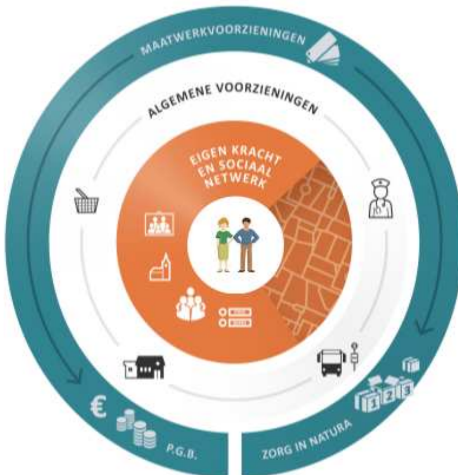
Figuur 1: Ontwerp Wmo Oostzaan 2015

Het uitgangspunt is dat gemeente Oostzaan meer uitgaat van eigen kracht en de kracht van het sociaal netwerk. Ook gaat het ontwerp van de Wmo (figuur 1) er van uit dat de algemene voorzieningen voorliggend zijn op de maatwerkvoorzieningen. Door middel van een preventief werkende lokale ondersteuningsstructuur kunnen de algemene voorzieningen dichtbij inwoners gerealiseerd worden. Hiermee kan de druk op maatwerkvoorzieningen waar mogelijk worden verminderd. De maatwerkvoorzieningen zijn voorzieningen voor inwoners die niet of niet voldoende op eigen kracht of met behulp van de algemene voorzieningen in staat zijn om in de samenleving te participeren. Eigen kracht, het sociaal netwerk, algemene voorzieningen en maatwerkvoorzieningen zijn verschillende lagen binnen de Wmo die er gezamenlijk voor zorgen dat de benodigde ondersteuning op maat geboden wordt.