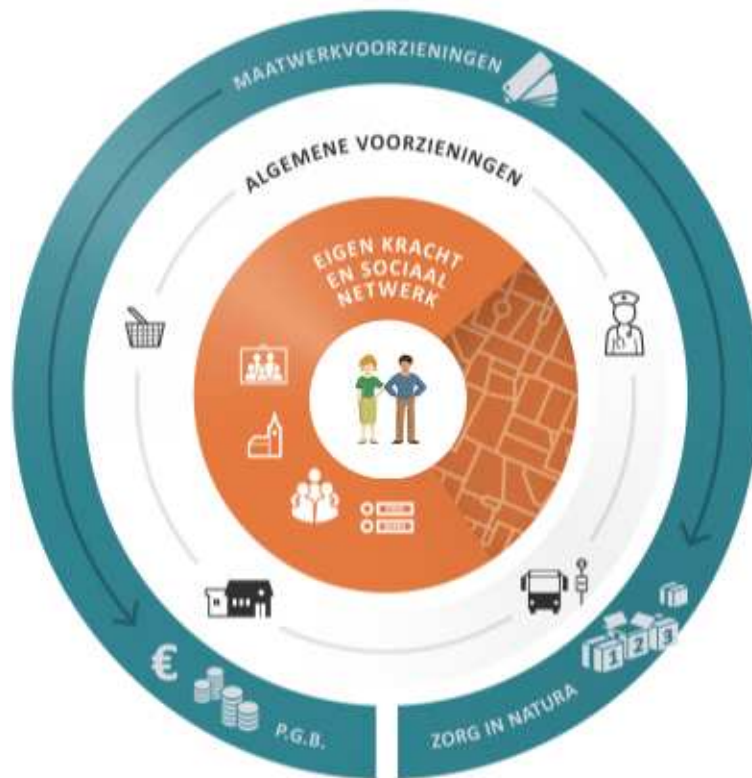
Figuur 1: Ontwerp Wmo Oostzaan 2015